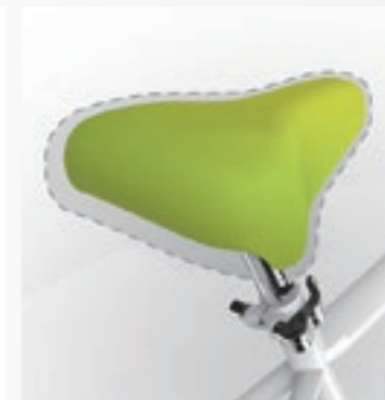
必要十分な大きさの小型サドル