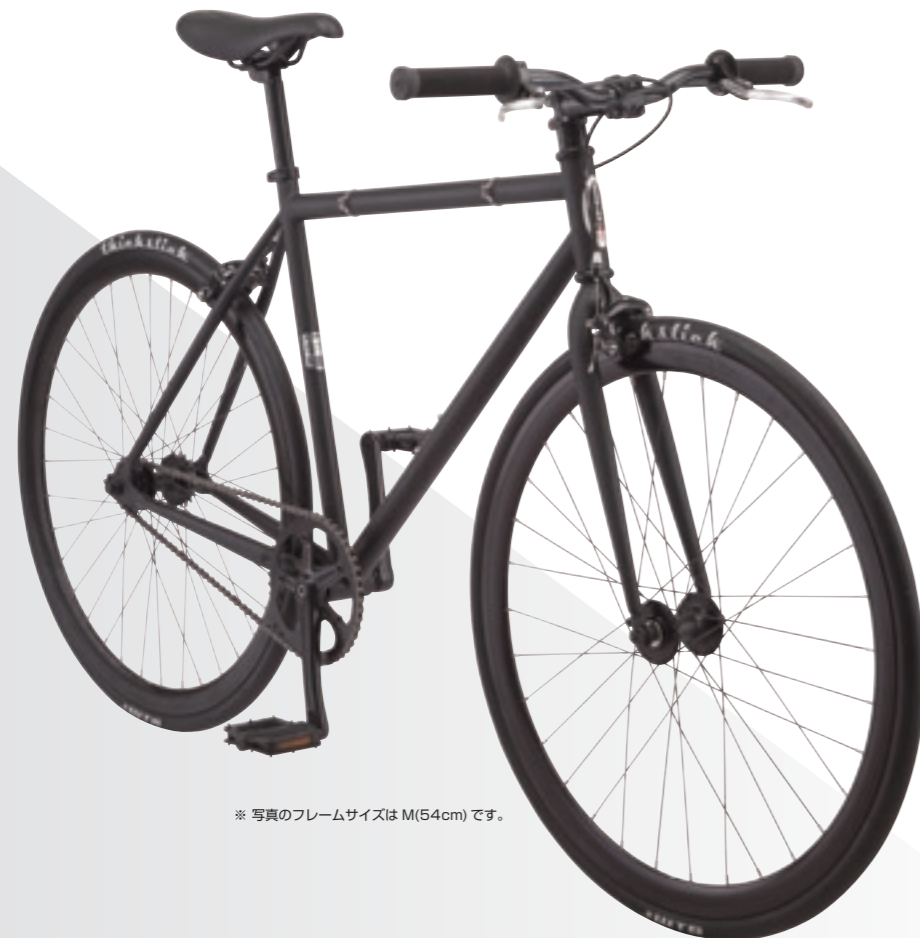
※ 写真のフレームサイズはM(54cm)です。

フレーム SCHWINN シングルスPEED ハイテン スチールフレーム、120mmエンド フォーク SCHWINN リジッド スチールフォーク、1.1/8"コラム、100mmエンド タイヤ FREEDOM シックスリック、700x28C、仏式バルブ クランクセット アルミ 3ピース、46T、170mm ブレーキ アルミ キャリパー リアスプロケット 18T コグ/18T フリー 重量 12.1kg (M) ※ 適応身長は参考値です。 適合するサイズの選定は正規販売店にご相談ください。