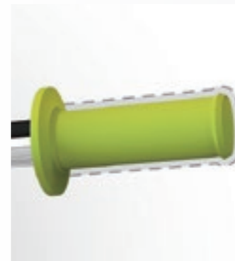
握りやすい細径グリップ

子供の身体に適したフレーム設計、車体重量の軽量化、快適性と安全性を重視したパーツ選定など、お子様のことを第一に考えて設計された「スマートスタート™ コンセプト」キッズバイク。“エアロスター”、“スターダスト”、“グレムリン”、“リトル スターダスト”に採用されています。