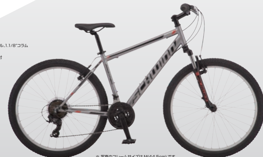
※ 写真のフレームサイズは M(44.5cm) です。