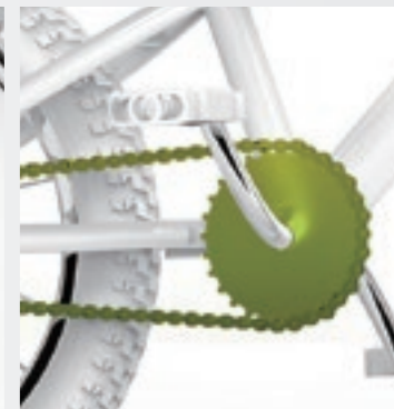
小さなお子様の力でも漕ぎやすいサイズのチェーンリング、クランク、ペダル