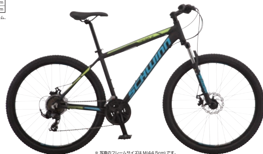
※ 写真のフレームサイズは M(44.5cm) です。