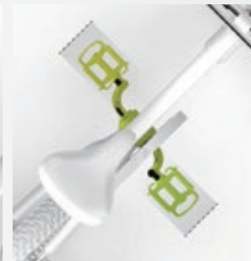
Qファクターが小さく、ペダリングしやすい位置に設定されたクランク