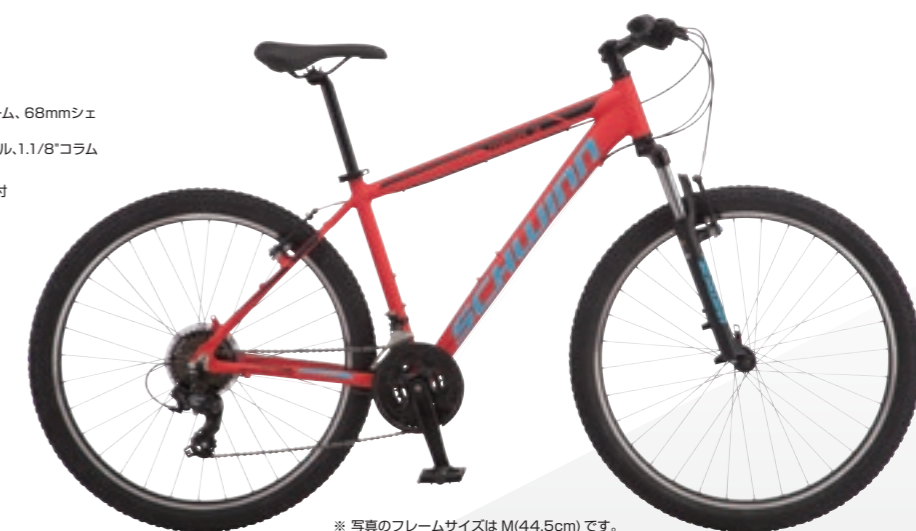
※ 写真のフレームサイズは M(44.5cm) です。